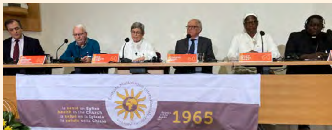
Rondetafelgesprek over sociale bescherming in de wereld