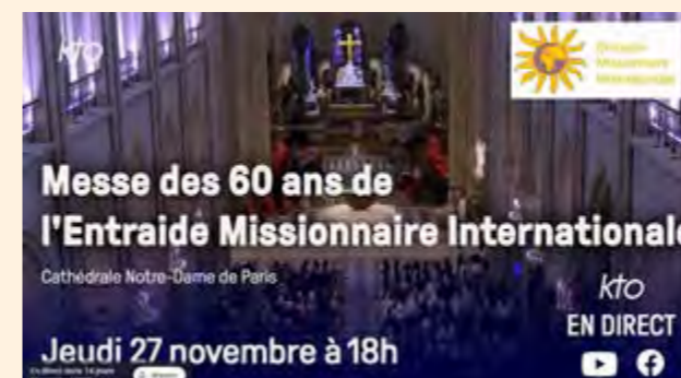
Dankdienst in de Notre-Dame van Parijs