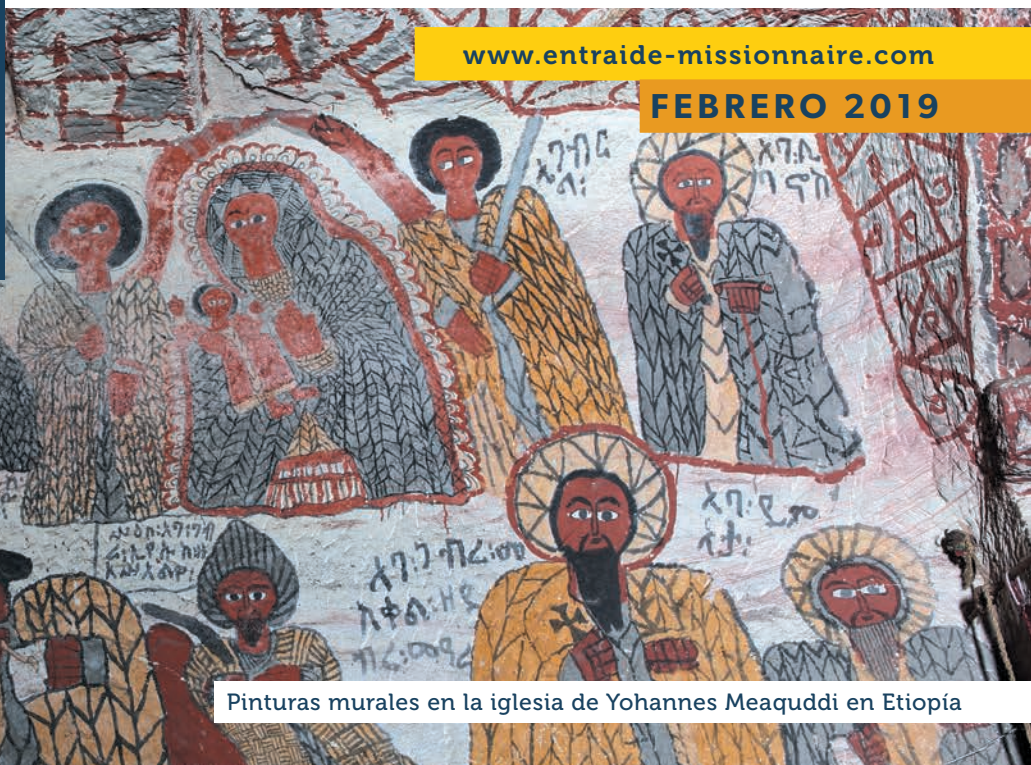
Pinturas murales en la iglesia de Yohannes Meaquddi en Etiopía