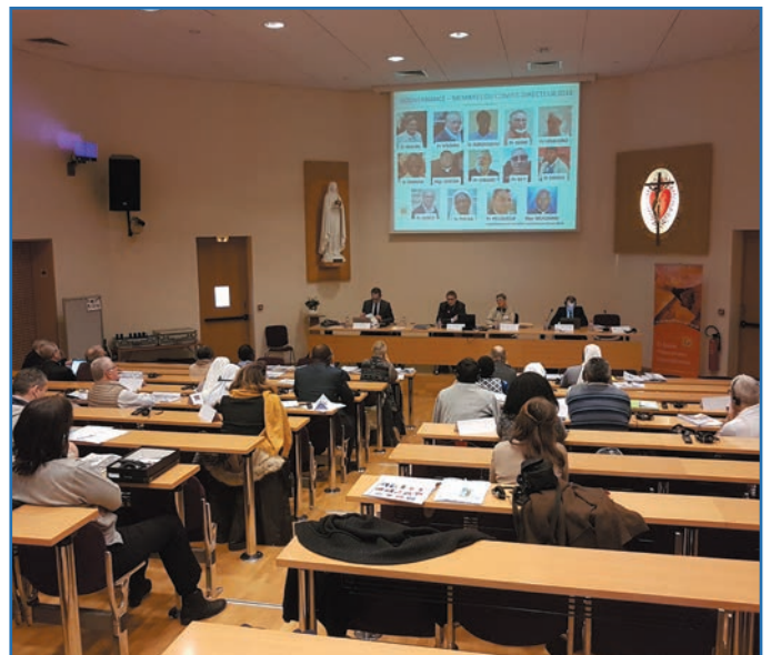
El Comité Ejecutivo en el anfiteatro