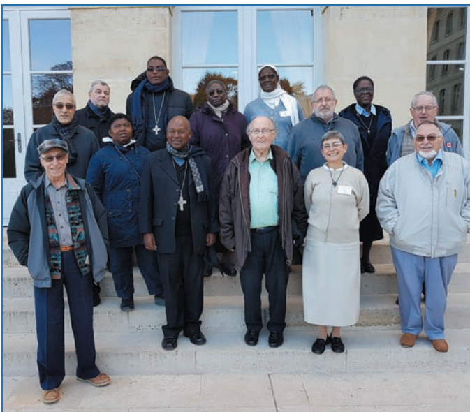
El Comité Ejecutivo 2018