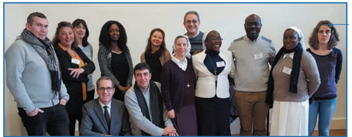
Los responsables y los administradores de secciones AMI