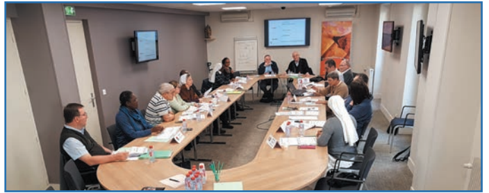
Las secciones en reunión con el Buró AMI