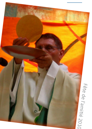
Fête de l'amitié 2010