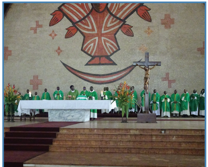
Messe à la cathédrale de Yaoundé