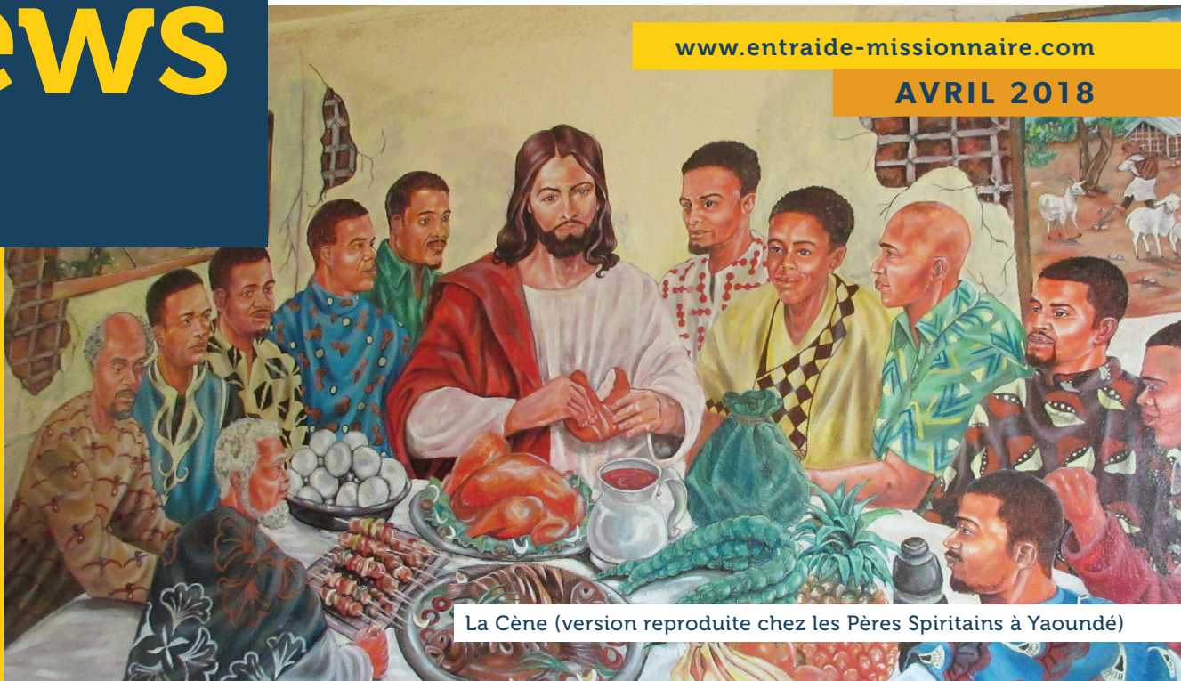
La Cène (version reproduite chez les Pères Spiritains à Yaoundé)

La lettre d'informations de l'Entraide Missionnaire Internationale