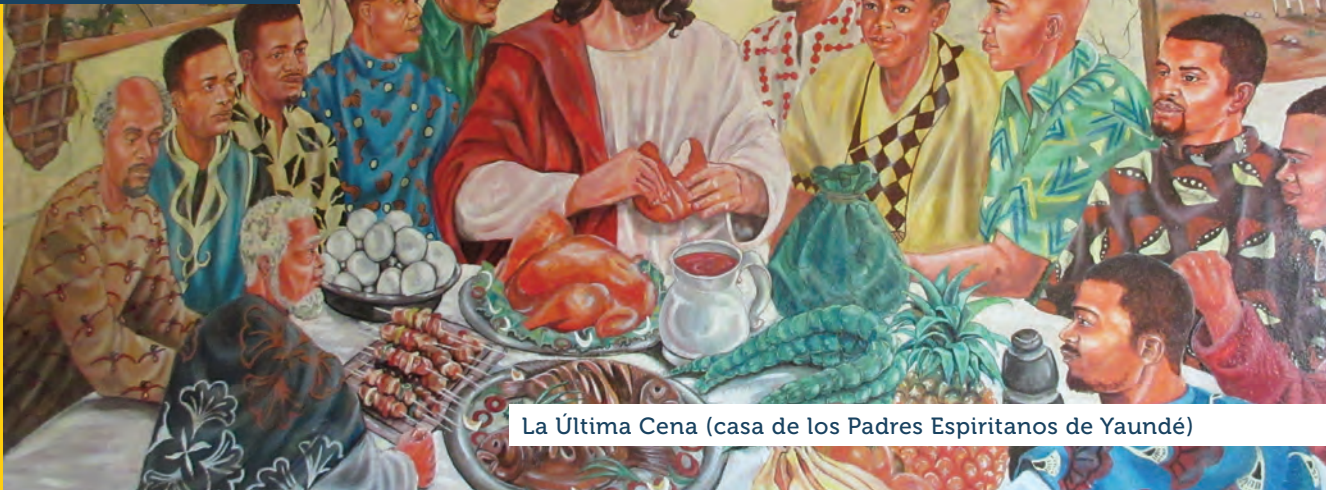
La Última Cena (casa de los Padres Espiritanos de Yaundé)