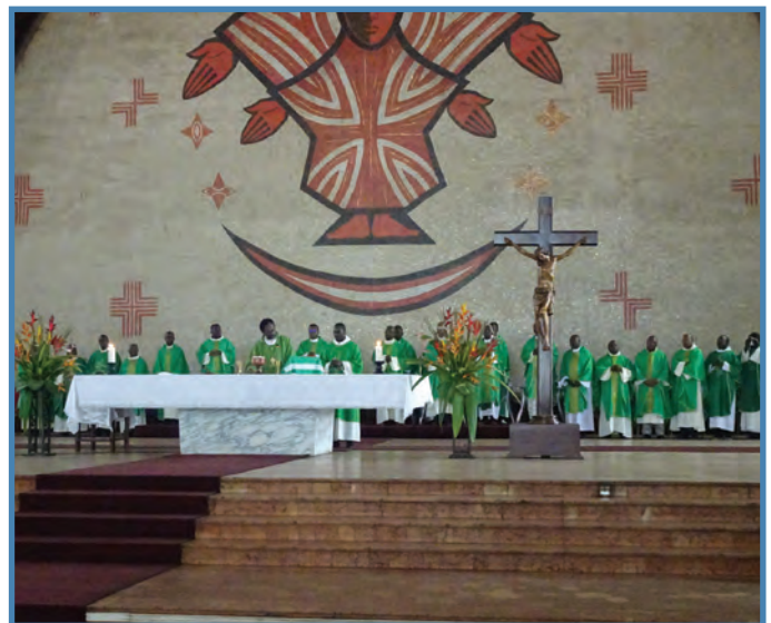
Misa en la Catedral de Yaundé