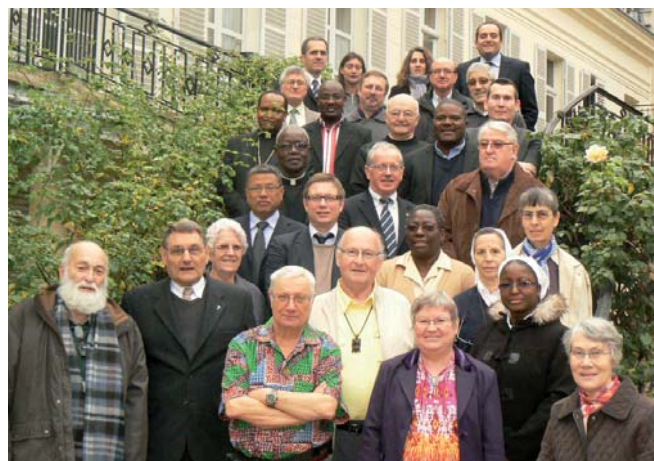
Les membres du Comité Directeur de l'EMI, Responsables de Sections, et opérationnels.

Les tarifs de cotisations 2013 ont pu être révisés avec mesure. En effet, l'analyse de l'actuaire permet une vision sur plusieurs années et donc une anticipation. Les taux de remboursement sont inchangés pour 2013.