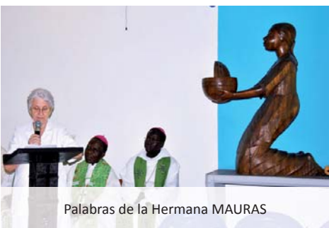
Palabras de la Hermana MAURAS