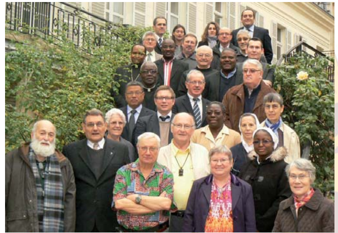
Miembros del Comité Ejecutivo de AMI, Responsables de Sección y puestos operacionales.

Las tarifas de las cotizaciones para 2013 se han podido revisar con moderación. En efecto, la auditoría permite una visión de conjunto sobre varios años, y también una anticipación. Los porcentajes de reembolso permanecen estables en este 2013.