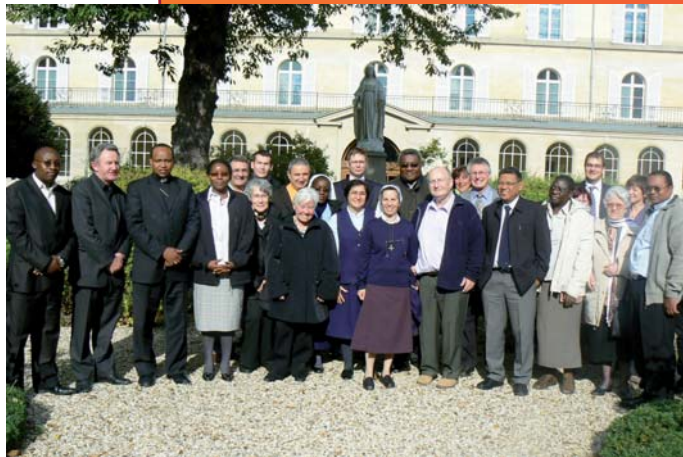
Réunion du Comité directeur tenue du 21 au 23 octobre 2009.